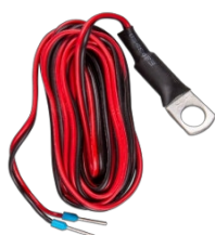
Teplotní čidlo pro zařízení Quattro, MultiPlus a GX (např. Cerbo GX)

Adaptér GX Touch pro výřez CCGX Tento adaptér je určen ke snadné výměně displeje CCGX s novějším zařízením GX Touch 50 nebo GX Touch 70. Obsahem balení je kovový držák, plastový rámeček a čtyři montážní šrouby.