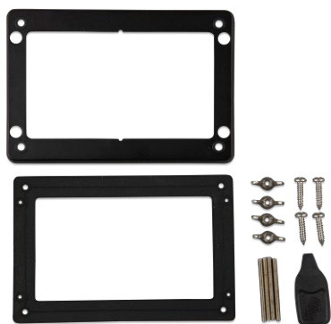
Príslušenství dodávané se zařízením GX Touch