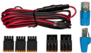
Příslušenství dodávané s e z a ř í z e n í m Cerbo GX