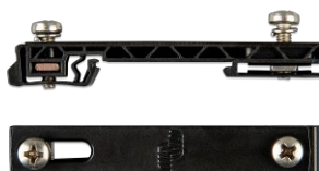
Adaptér DIN35 malý Adaptér na lištu DIN pro snadnou montáž zařízení na lištu DIN. Vhodné pro Cerbo GX.