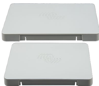
Ochranný plastový kryt GX Touch 50 a 70

Indikátor LED WiFi Cerbo GX se může připojit k síti WiFi