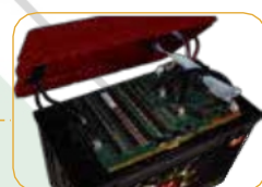
● Otevření šroubu