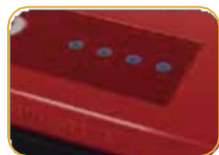
● 4 Provozní displej