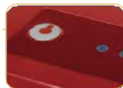
● Tlačítko Reset