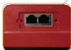
● Komunikační rozhraní terminálu